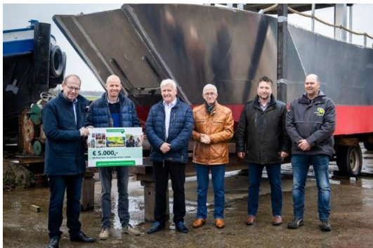
Stichting Fiets- en Voetveer Arcen-Lottum kan nu ook rondvaarttochten over de Maas aanbieden